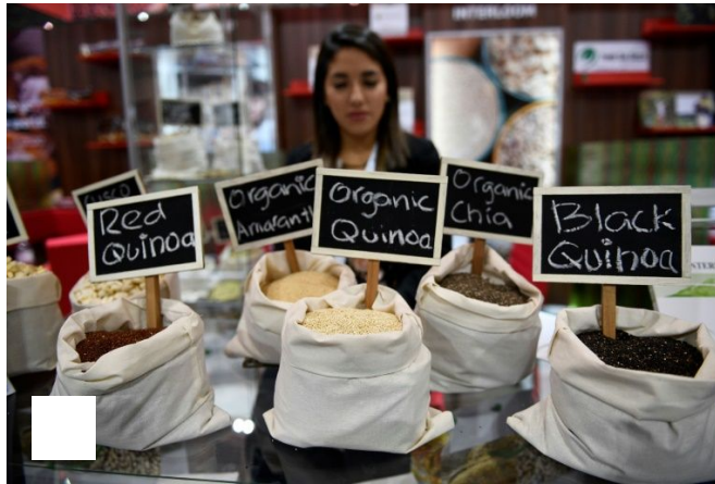
Diferentes tipos de quinoa en la feria internacional de alimentos SIAL 2016 el 16 de octubre de 2016 en Villepinte, en las afueras de París

Por Isabel MALSANG 22 de octubre de 2016